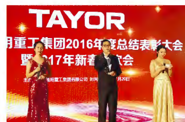
▲新春联欢会主持人