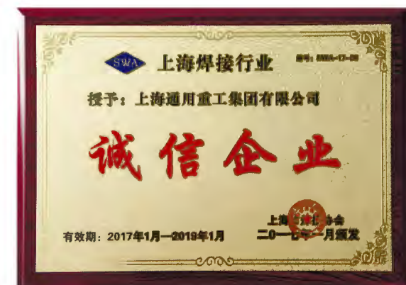
▲上海通用重工集团有限公司获“2016年度上海焊接行业诚信企业”称号

机、焊接技术研究及焊接技术培训为一体的全产业链大舞台，集团未来的发展要依托国家焊接产业技术创新战略联盟平台，加快技术升级，加强自主研发能力，融合市场发展，用中国焊割设备解决中国智造难题，开拓更大的局面；陈董事长在讲话中分享了（下转第二版）