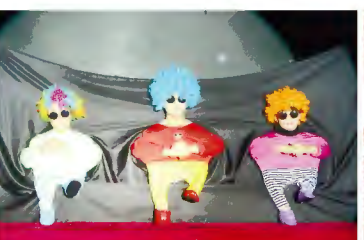
▲小人舞《Little People Dance》