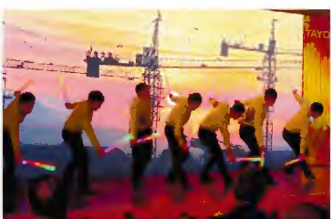
▲产品音乐秀《上海滩》