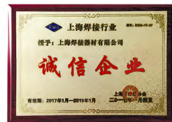
▲上海焊接器材有限公司获“2016年度上海焊接行业诚信企业”称号