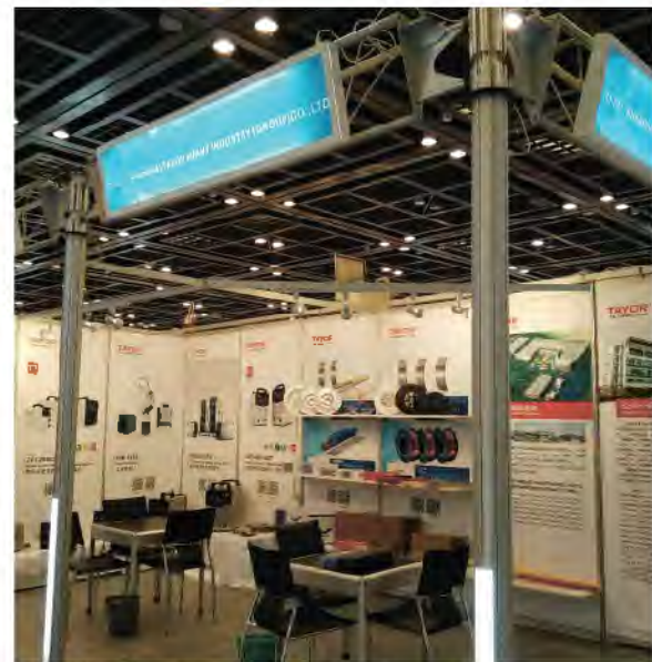
▲迪拜国际五金工具展集团展区

2016年5月25日，第17届中东阿联酋（迪拜）国际五金工具展在迪拜国际会展中心盛大开幕，上海通用重工集团携数字化焊机和焊接材料倾情参展，展会历时3天，集团公司凭借产品出众的焊接性能、高效节能的特点以及新颖的外观吸引了众多观展者驻足洽谈，尤其受到阿联酋（迪拜、沙迦）、沙特等周边国家的客户青睐。（梁欢）