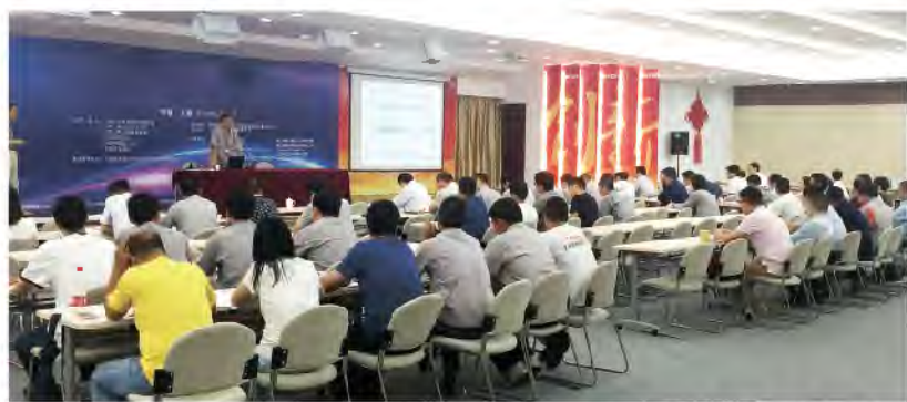
▲新版质量管理体系知识培训

为全面提高集团质量管理标准化水平，有效促进集团质量管理体系转版工作的顺利推进，近日，质量管理部会同电焊机事业部、焊材事业部、切割自动化装备事业部聘请中国检验认证集团上海有限公司专家，利用双休日