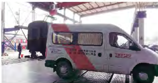
▲通用电焊机客户服务车在成都铁路局火车车架焊接现场

近日，电焊机事业部数字化焊机成功应用于成都铁路局火车车架、车轮连接等焊接项目，为我国西南地区轨道交通贡献焊接力量，印证了TAYOR上海通用电焊机的可靠品质和影响力。成都铁路局辖管12条国家铁路干线、10条国家铁路支线以及5条合资铁路，辐射四川省、贵州省、重庆市、云南省、湖北省，是中国铁路总公司旗下大型铁路运输企业的18个铁路局之一。成都铁路局管理营业站559个，正线延展里程7811.8km，营业里程6154km，重要指标名列全国铁路前列。（陆军）