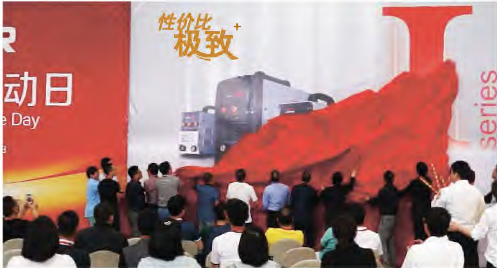
▲“I系列数字化焊机”揭幕仪式

会上，电焊机事业部产品经理对“I系列数字化焊机”进行技术参数、产品性能与特点的介绍。“I系列数字化焊机”是搭载32位数字化核心处理平台的先进技术，运算速度快、反映敏捷、起弧性能卓越；核心