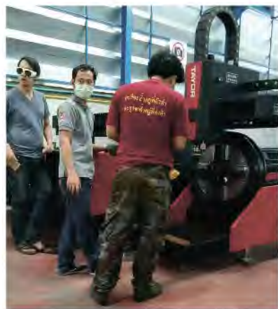
▲泰国SICNC公司安装调试现场

每一次创新，都是一种超越，通用势必将创新理念延续，在未来，上线更多新品服务于市场！（编辑部）