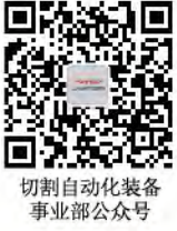
切割自动化装备 事业部公众号