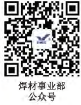
焊材事业部 公众号