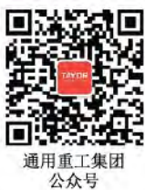
通用重工集团 公众号