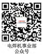
电焊机事业部 公众号